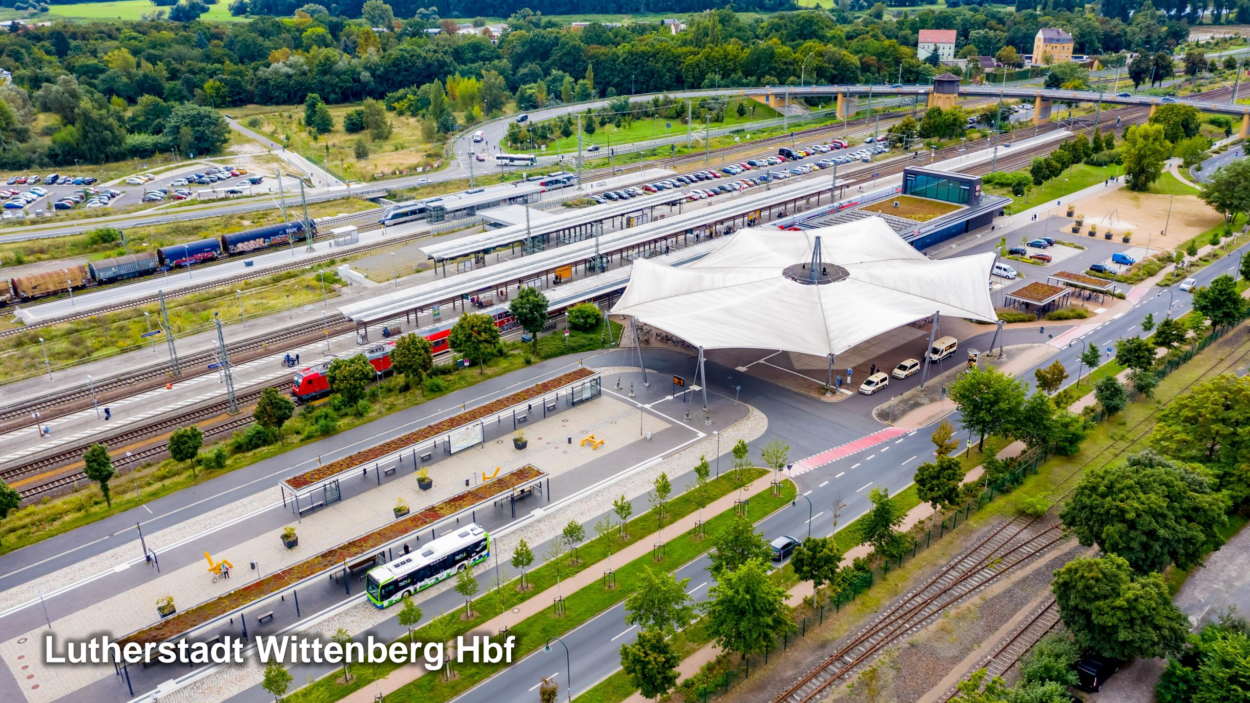
Lutherstadt Wittenberg Hbf